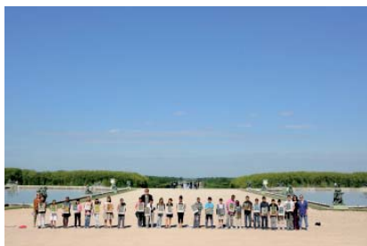
Les élèves de la classe de CM2 de l'école Montaigne de Poissy présentent leurs dessins de la façade des grands appartements du chateau de Versailles.

AU COURS DE L'ANNÉE SCOLAIRE 2010-2011 , six cent cinquante élèves de vingt-trois établissements du département des Yvelines ont emprunté un « parcours du patrimoine » à travers la proposition « Dessine-moi un château ». De nombreuses classes du primaire et du secondaire d'écoles et de collèges des zones d'éducation prioritaire ont ainsi été associées dans le cadre de démarches inter-degrés. Pour le secondaire, ce projet a revêtu un caractère majeur dans la pratique pédagogique des enseignants, en proposant une plus large ouverture interdisciplinaire. Les enseignants ont pu mettre en œuvre leur propre projet pédagogique, en s'appuyant sur les ressources documentaires, les médiateurs culturels et les propositions