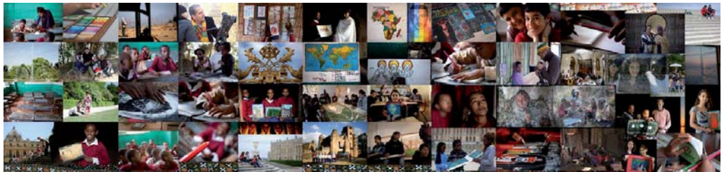
Parcours, de Gondar à Versailles. Mosaïque photographique. 110 x 930 cm.

LIEU DE FABRIQUE, mais également espace documentaire, il s'agit d'évoquer les ateliers (et notamment leur ambiance) ayant conduit à la réalisation des dessins et des œuvres des élèves. Cet espace rend compte de toute l'action et de la multiplicité des interventions conduites par les différents acteurs du projet.